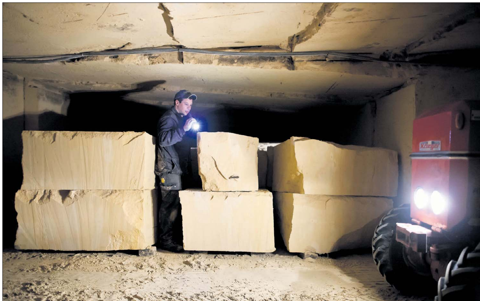
Mergelwinning voor de Geulpoort in de groeve van Kleijnen.