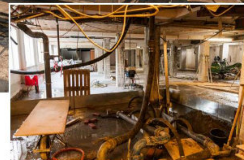
Sloop van de entree