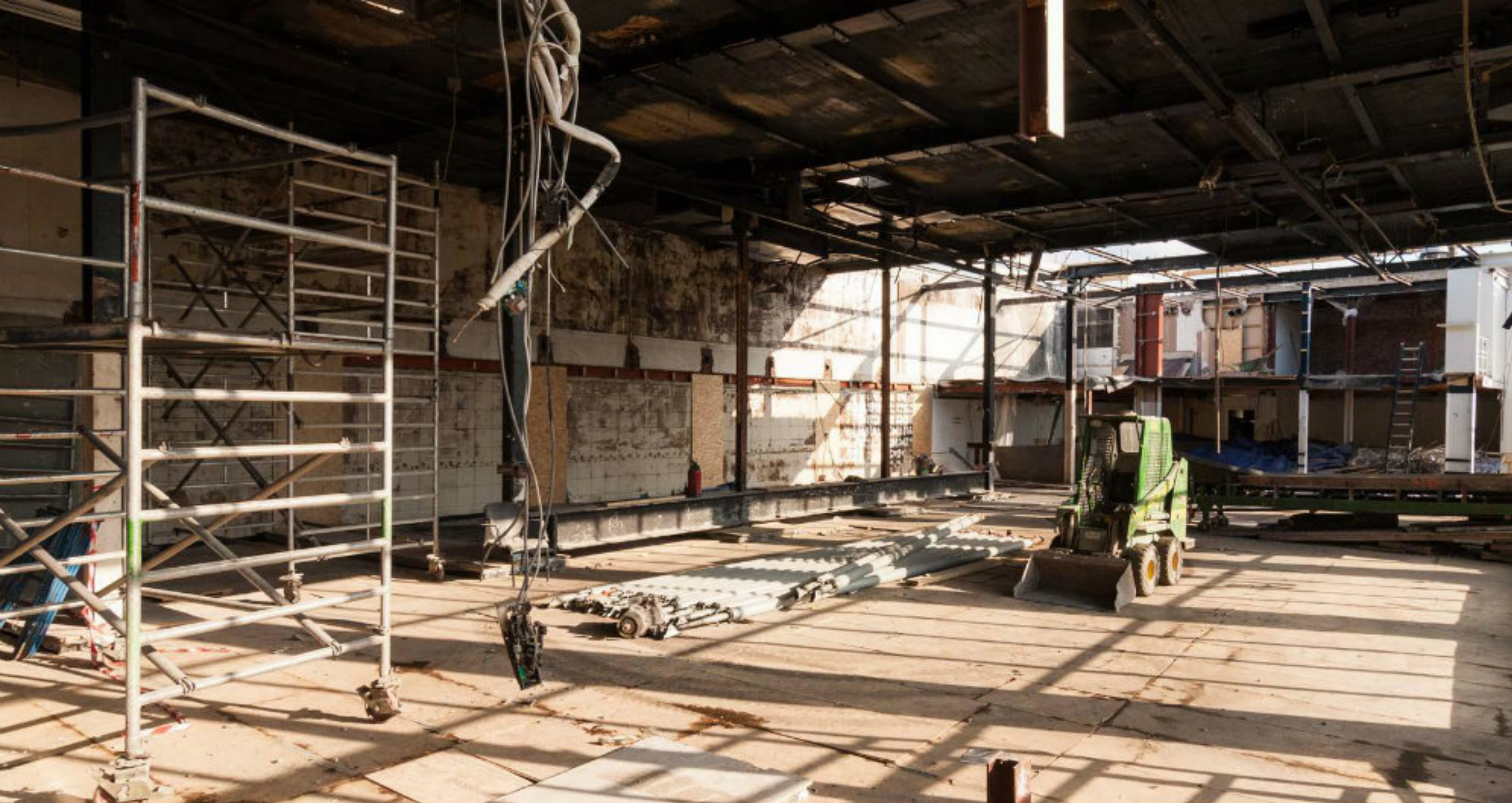
De Blauwe Zaal gestript